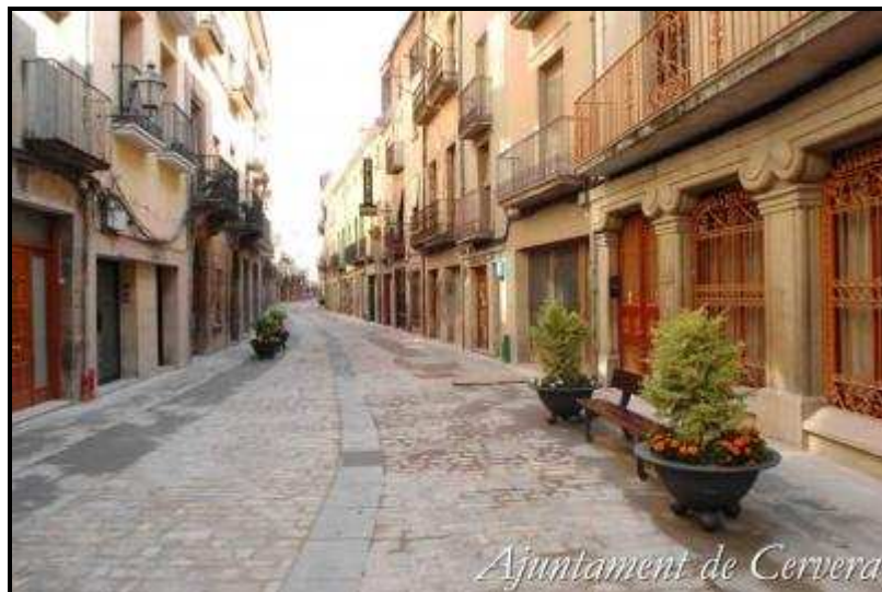
Ajuntament de Cervera

En el número 115 es troba la Casa Duran i Sanpere, casa pairal d'Agustí Duran i Sanpere, historiador de Cervera. Actualment hi ha el Centre Municipal de Cultura, l'Oficina Comarcal de Turisme i el Museu Comarcal de Cervera.